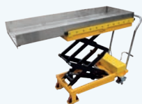
Table de transport hydraulique

Fournit un moyen plus facile de soulever des poids jusqu'à 150 kg. Un lit extensible pour un chargement plus sûr. Hauteur réglable jusqu'à 1.3 m avec un levier de traction pour abaisser en douceur la table.